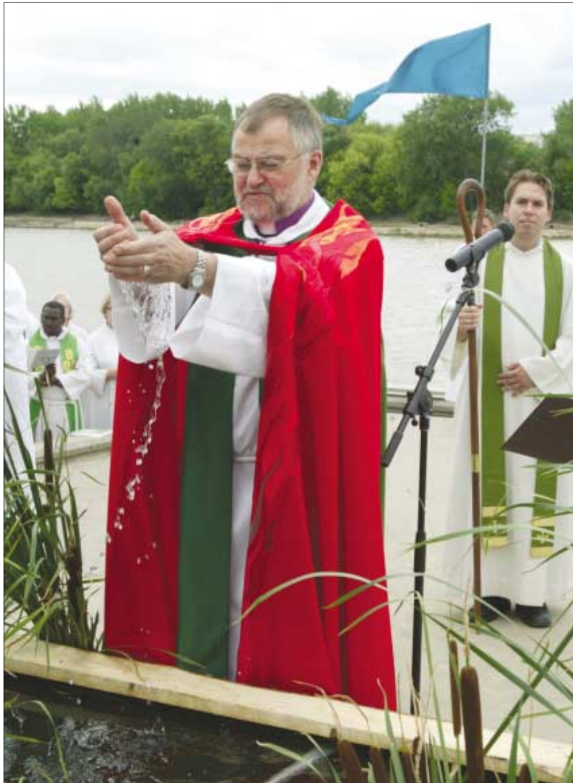
National Bishop Raymond L. Schultz of the Evangelical Lutheran Church in Canada performs the Affirmation of Baptism at the banks of the Red River prior to proceeding to the St. Boniface Cathedral for the remainder of the Opening Eucharist.

Rainer Lang Assembly Newspaper Coordinator