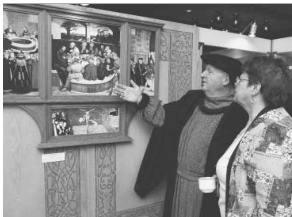
The Town Church altar was painted after Luther's death and shows the preaching reformer, the baptizing Melancthon, and Johannes Bugenhagen, parish priest, in a confessional scene.

The exhibition from Luther Centre in Wittenberg, Germany in conjunction with the Lutheran World Federation will open the display daily at the Convention Centre from 9:00 a.m. to 9:00 p.m., July 22–26, 28–30 (closed July 27).