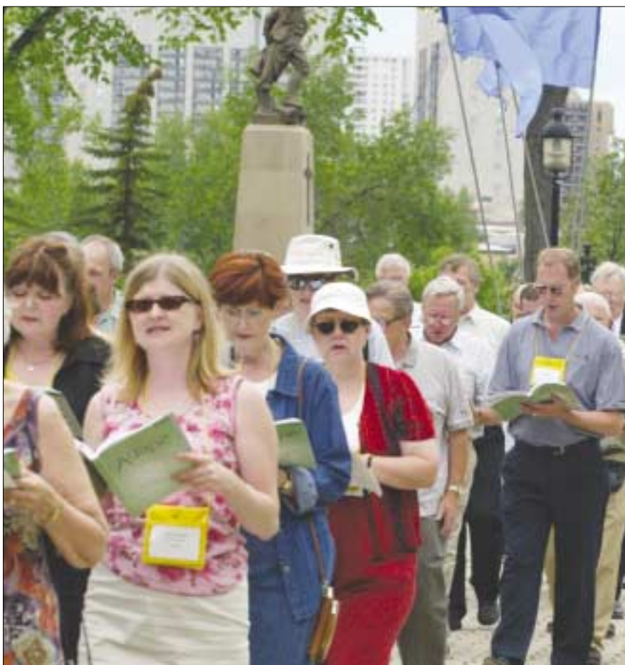
Opening Eucharist procession from the banks of the Red River to St. Boniface Cathedral.